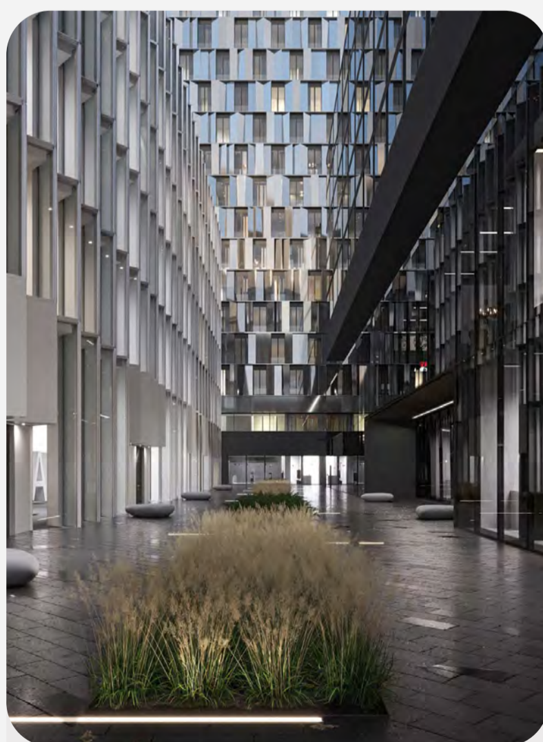
Ритейл на трафике