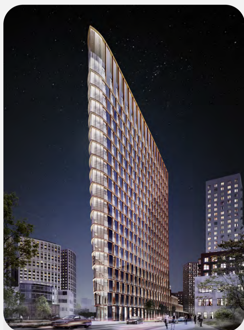
Офисы класса А и В+