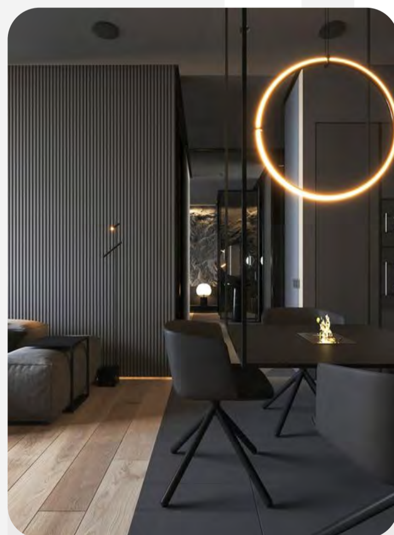
Жилье премиум и бизнес-класса